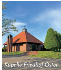
Kapelle Friedhof Oster