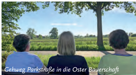
Gehweg Parkstraße in die Oster Bauerschaft