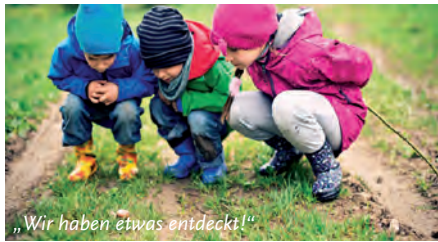
„Wir haben etwas entdeckt!“